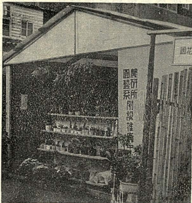
推廣中心門面

據經理林順達同學表示，該中心除銷售園藝系所師生繁殖的盆栽植物，如天竺葵、三色薑、大岩桐等外，並供應園藝器材、培養土、種籽、及各式的鮮花種類相當的繁多。而為擴大服務的範圍，該中心將接受需要者的預訂，並有