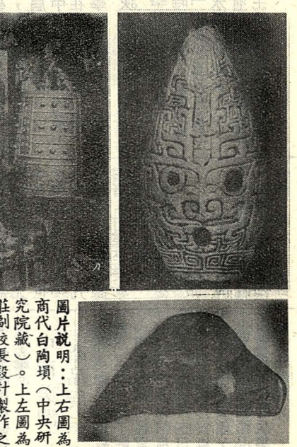
圖片說明：上右圖為商代白陶埙（中央研究院藏）。上左圖為莊副校長設計製作的特磬。（台北孔廟）下右圖為商代綠黑色石特磬（中央研究院藏）。

國樂裡有特別音色的管樂器就是「笛子」，它與外國的不同，因為我們的有笛膜，音色嘹亮，西洋的沒有，音色柔和，屬木管樂器類。我國笛子的膜最好用「葦膜」。因竹膜比較脆，重貼時易破。小一點的笛子叫「梆笛」。原為北方梆子戲伴奏所用。笛膜的作用是擴大音量，並能產生嘹亮的音色。「笙」是我們中國特有的樂器，可以吹奏和音。每管下面有一簧片，用以發聲。古代時，下面的氣斗是葫蘆做的，後來改為木斗，現在則多用銅製，笙上並沒有進嘴，僅在管之下部鑽一小孔，用以控制發音。這種物理上的進步，按下面的小孔就響，放開就不響，這完全符合物理上的共鳴原理。笙為什麼不將各管膠牢固定呢？因為夏天簧片會漲，聲音變低；冬天簧片縮短聲音就變高。所以它必須調音，音太高時，在簧片端部加一點臘，增加重量使振動慢而音變低；反之，刮去一點臘，震動稍快音就變高了。