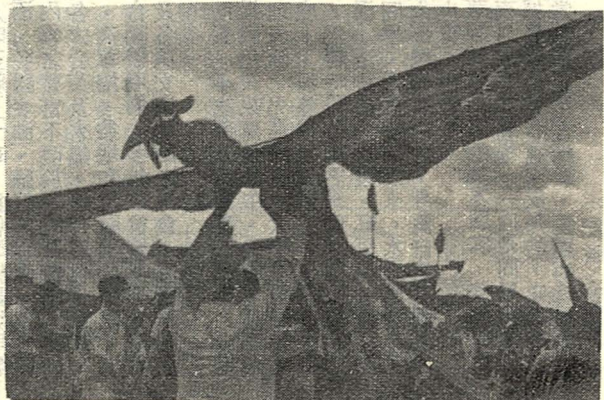
△右圖：大型的彩風箏。

題。單以「放風箏」來講，就是一種值得提倡有益身心健康的戶外休閒活動。終日在教室內上課的學生們，以及經常伏案工作的人們，如果能於週末假日，到郊外、海邊去放風箏，不但可以調劑精神增加生活情趣，同時又可沐浴在驕陽下飽吸新鮮空氣，對身體的健康一定大有裨益。一個人如果經常與大自然為伍，翹首仰視一望無際的藍天白雲，無形中會使胸襟開闊明朗，使人生觀更加豁達積極。