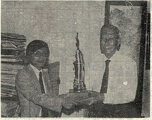
圖為北區大專詩壇亞軍；獻於創辦人

「現代文學研習會」，這是多年來首次全校性的現代文學活動，目的在使所有華岡人都能明瞭