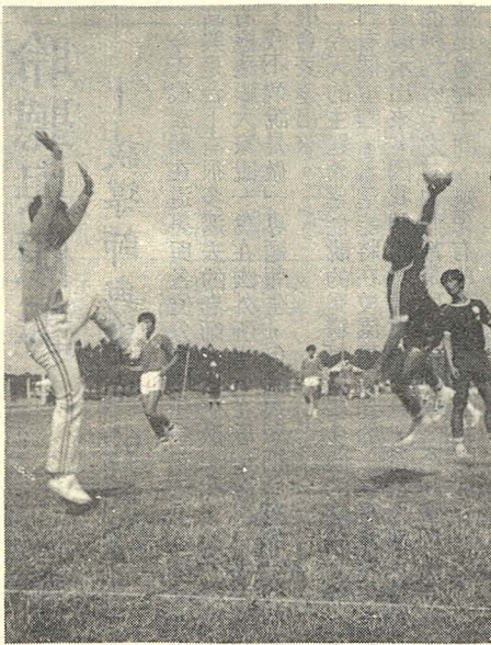
△優美的射門動作之一

我國手球運動的推展，遠在民國二十五年即由留德歸國的學者吳激（字仲歐）教授傳入，手球於是在國內逐漸成長。直至民國五十五年，台灣省教育廳將手球列入國小體育科教材，