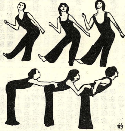
△本文所附的四張圖片均為爵士體操的示範動作

子性或強烈的衝動性。故爵士體操是綜合爵士舞蹈、韻律體操為一體的運動，其特徵是使用爵士音樂節奏為靈魂的一種自然運動。爵士體操最能吸引人的魅力是基本動作從擺動開始，首先身體的一部份擺動，然後其它部位也隨著擺動，於是全身就能擺動，於擺盪是以身體的一部份作支點的脫力運動中產生。這種動作類似鐘擺運動，在力學上是最有效率的運動，也能引生或擴大動作的可能性。爵士體操對人們具有身體扭動的快感和喜悅感，也可說是美化以往的體操，迎合大眾的運動，對健康頗有益，這種自然 的扭動比以往一板一眼的體操更富精神上的充實感，在爵士體操裏把這種情況稱為「陶醉」(Ecstasy)，即身體韻律與音樂一體化所得到的衝動與快感。由此可知爵士律動和爵士特有的動作而釀成的本能運動，能使人達到解放感及忘我的境界。