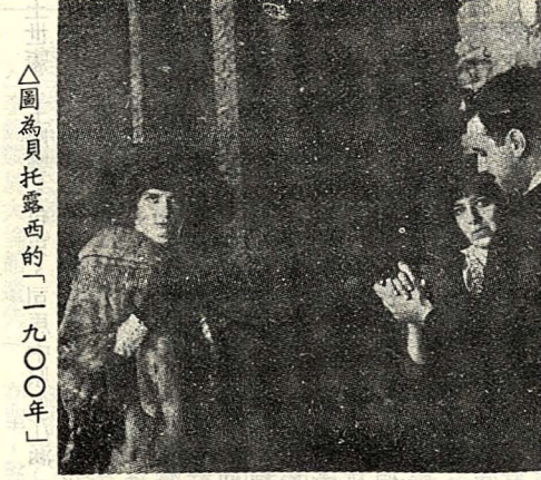
△圖為貝托露西的「一九〇〇年」

，故事是無結局的四、畫面對於電影的構圖、組合、剪輯，過去十分注重文法和規律。 現代電影打破了文法和規律的限制，往往把不同的畫面穿插一起，並且能把握心理那的意念表現在畫面上。認為藝術的最高境界是自由的、不受拘束的。美國音樂劇聖手史坦利·杜南(Stanley Duenen)的作品「擺人行」(Twelve Men on the Road, 1966)便是利用不平凡的技巧織成的，表現得極為別緻和細膩。全片的劇情非常簡單，只敘述一對結婚十二年的夫婦婚前及婚後的種種景象，可是那股自由描寫的流利筆法，的確使人稱讚不已。 他山之石可攻玉 知識爆發的今天，學術進展，一日千里，而國片仍不能「起飛」，原因很多，而觀眾欣賞水準的低落是其一。為應付現代電影的多義、難懂，全面提高欣賞素質，普及電影教育，實為勢在必行；個人的電影修養也不可無，因此，多看影評、報導，並注意吸收新知，亦為刻不容緩之事！