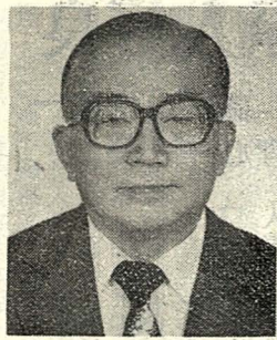
談修教授（見圖）現年六十八歲，上海市人。曾任教於中外文武大學，作