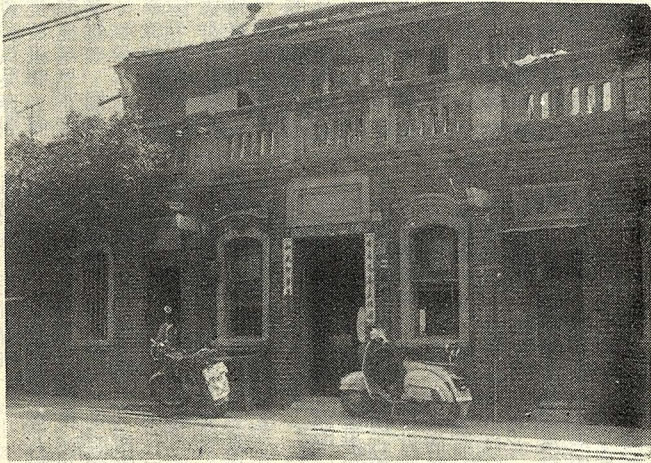
△圖為作者故居——鹿溪大雅齋

中華民俗藝術基金會於七十九年九月十日，在鹿港民俗文物館舉行「國際南管音樂會議」，議程四天，邀請國內外學者專家參與，由各種角度來討論南管戲曲的淵源、表演型的價值。與會的名單如下：菲律賓大學教授蘇志祥、香港中文大學教授陳蕾士、前台