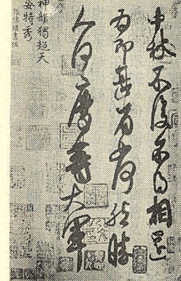
△圖一：中秋帖 「為中秋不復不相 還為即甚省如何然 勝人何慶等大眾」

其辭多復，問矣不茂實；所以貴於人間者，筆畫勁利，態致蕭疏，無一點土氣，無一分桎梏束縛，非勉強仿效可以夢見。」（墨林快事）