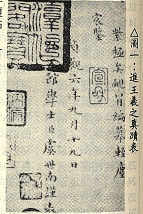
△圖一：進王羲之真蹟表

刻石銘、嘉瑞賦（等正書）最聞于時，又載宋內府所藏伯施書跡十三種：「行草：積年帖、借乳鉢帖、枕臥帖、疏會帖、翰墨帖、賢士帖三、汝南公主銘表。草書：論道帖、關內帖、前書帖、臨張芝平復帖。」 鄭樵「通志·金石略」載虞書八種，除「孔子廟堂碑」，尚有書千文後小楷七百餘字、孔憲公碑、頌善人墓誌、隋隆聖宮道場碑、白鶴詩、孔憲公碑、頌善人墓誌。另有：積時帖、理頭眩藥方帖、蚱牙帖、頌風帖（書史）、孔子廟堂碑真跡、高僧帖（趙蘭坡所藏書目錄）、孔穎達碑（金石錄）、破邪論序、中楷千文、大字攀龍麟附鳳翼（書訣）、東觀帖（珊瑚網）、奏草真蹟（寓意篇）、啟師帖（唐氏玄覽）、心經（攻媿集）、寶雲塔銘、龍馬圖贊（考榮餘事）、臨蘭亭敘（墨緣覓觀錄）、進王羲之真蹟表（王羲之真蹟在臺灣圖一）等多種。