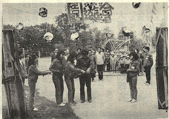
△圖為水里鄉公所卓秘書為園遊會主持。

(本報訊)由華岡社會服務隊主辦之第五屆服務性社團西瓜盃聯誼賽，定於今(十七)日下午四時半假大義排球場舉行開幕。本屆聯誼活動為期一週，內容有排球、足球賽、趣味競賽、大隊接力及演