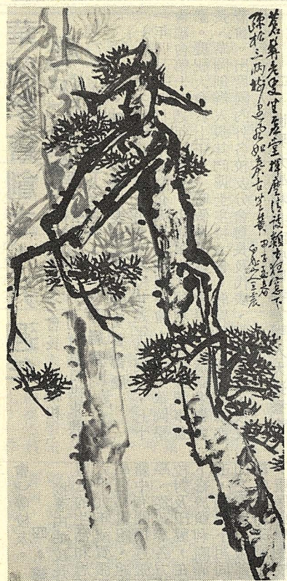
吳昌碩先生畫松... 王震... 一九二四年所作... 號北郊白龍山麓... 四歲以後，別號白龍山人，生於清同治六年（一八六七年），卒於民國二

編者按——本校華岡合唱團將於本月二十一日晚上七時三十分，假國父紀念館舉行第八屆公開演唱會。