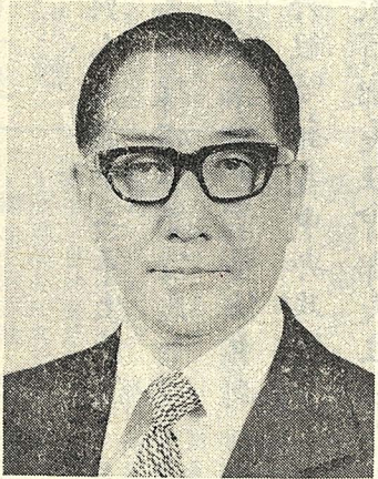
生先國緯蔣司令總勤聯爲國

我們爲了追求這樣理想的羣體求生方式，所以要堅決反抗奴役人民的極權暴政，也反對祇顧個體利益而不顧整體利益的個人主義，或祇顧自己的羣體利益而不惜犧牲摧殘其他羣體利益的帝國主義與國際霸權；更不能容許鼓勵人與人間仇恨與鬥爭的邪惡思想。因爲他們都違反了人類集體求生的自然合理法則，要導使人類退回野蠻時期，所以都是歷史的逆流。 領袖說：「今日之反共鬥爭，推本溯源，實爲思想與文化的戰爭。」又說：「當前反共戰爭，是我們中華民族爲了求生存、爭自由，而面對共產匪徒所作的思想戰、文化戰與主義戰。」這就明確指出了反共戰爭之本質，是爲了追求與保衛我們理想的羣體求生方式。共產邪惡思想，正爲索忍尼辛所控訴的「乃是要摧毀我們所認同的社會制度與生活方式。——無異要把人變爲獸，我們怎能不誓死反抗！」 領袖又指出剋制共產邪惡思想之道：「我以爲今日如要復興民族、消滅共匪，就先要復興我們的民族文化。」反過來說，我們之所以要復興民族文化，也就爲的是消滅共匪，拯救我們自己以及全世界人類；所謂救人以救己，救世以救國！可見復興中華文化，既是目標，又是手段；是我們立國之本，又是復國之大道！ 敬祝文化大學在學的青年朋友們，勿負校名上所懸示的崇高目標，在這以三民主義統一中國的歷史任務中，擔負起民族文化維護、宏揚者的神聖使命。