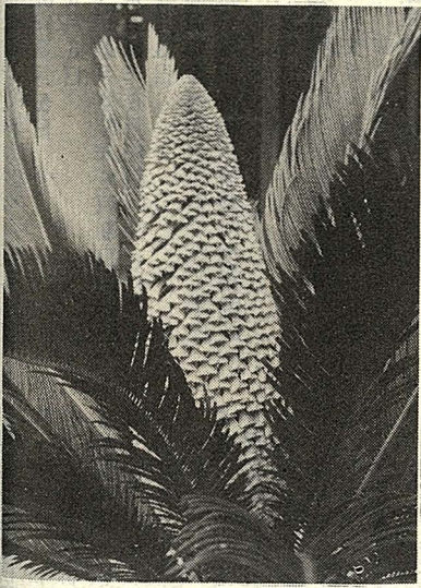
圖一：開圓錐形花之雄株蘇鐵。