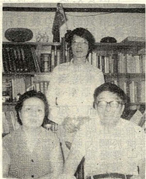
影合儂伉方東黎師恩與教有方

（本報特稿）「樂」是「五聲八音的總名」，音樂就是「比音而樂之」的意思。是「比音而樂之」的意思。音樂演奏的特質，就在於使各種樂器合奏時，能表現出音調和諧、節奏分明的效果。孔子告訴魯國的樂官：「樂其可知也。始作，翕如也。從之，純如也，皦如也，繹如也，以成。」孔子所說的正是音樂演奏時「合而能和」的道理。