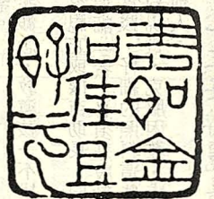
壽如金石佳且好兮