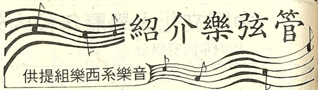
供提組樂西系樂音