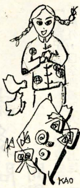
本報全體同仁鞠躬

系提供一九七〇—一九七一年度獎學金，金額二千五百美元，供本校有志赴該校修讀史學碩士的同學申請。