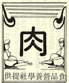
供提社學養營品食

本校哲學系與哲學研究所，體制上雖然分立，精神却是脈絡相續的。系上同學經常舉辦學術研究會