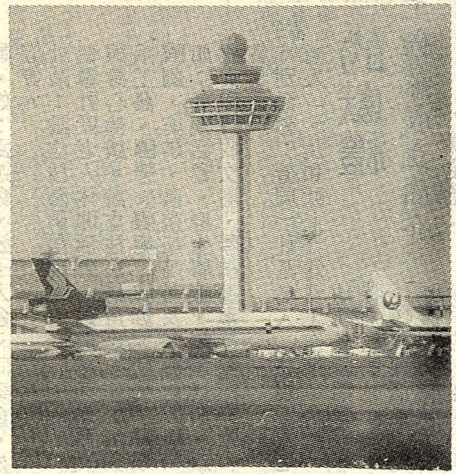
圖為新加坡國際機場之一景

寒櫻的栽培繁，一般有播種法與嫁接法。 (一)實生法：由於緋寒櫻為核果類種皮甚堅硬，因此於播種前需以利器敲破，並行浸水一晝夜處理後，便可於春期行露床播種了。 (二)嫁接法：為著達到栽培迅速與養成優良品種的花木之目的，緋寒櫻亦多作嫁接栽培。其法為以性狀較健強的實生苗株為砧木，而取他株生長俱佳的枝條為接穗，行切接或芽接。這樣便可利用下部健強的根群發育，供地上部優良枝條的充實發展。可得較佳良的開花外，並且能於短期間獲得開花株。 緋寒櫻性喜向陽高燥而冷涼處，在蔭地或濕地栽培、生育和開花結果都不好。對於土壤並不苛求，唯以砂質壤土為佳。