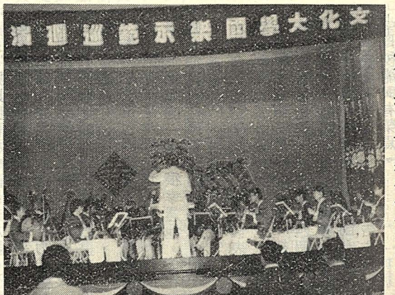
△在澎湖中正堂舉行敬軍演奏會。