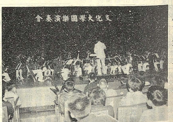
△在高雄市中正文化中心演出。