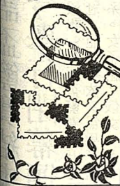
利馬竇來華四百週年紀念郵票