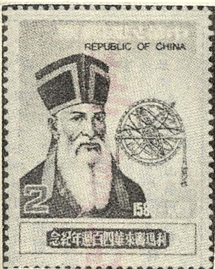
利馬竇來華四百週年紀念郵票

利馬竇於一五五二年十月六日生於義大利中部馬才提達城的一個貴族家裡，父親曾擔任市長與代理省長。他自幼聰慧過人，曾赴羅馬深造，在「羅馬學院」裡潛心研讀幾何、天文、地理等學科，奠下來華介紹科技的基礎。