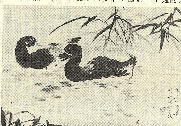
周士心作「蘆塘雙鴨」