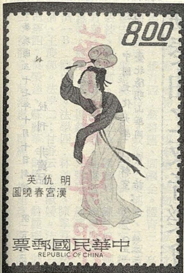
英仇明 圖曉春宮漢