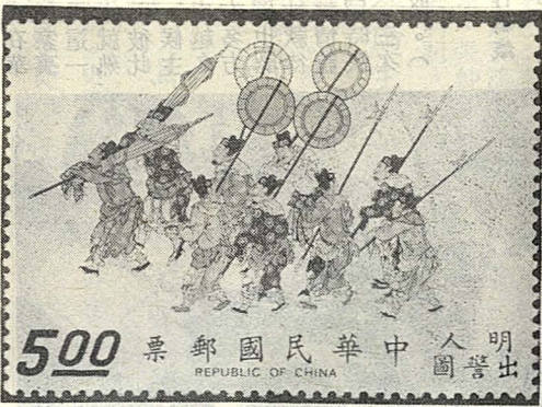
圖五：明人出警蹕圖—儀仗扇

出警蹕圖，係描繪明世宗調皇陵沿途之寫景，在出警蹕圖中御駕的左右，即列有儀仗扇，踐履而行（圖五），在此畫中，儀仗中的扇只有「圓扇」一種，分紅、黃、藍、白、黑五色，中心綉雙龍，