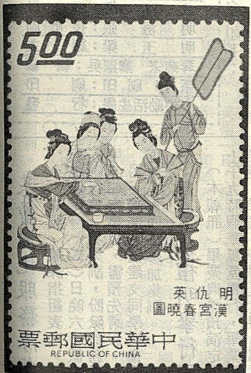
英仇明 圖曉春宮漢