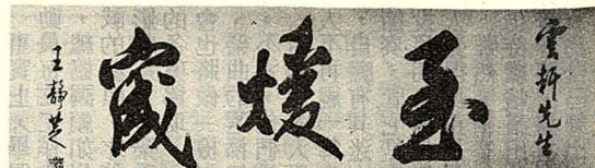
區署長所芝靜王所研文國大輔△

正如成先生惕軒題賜翰寶云：「鹿江雲物鍾靈秀；鯤海煙波入畫圖」。益見鹿港文風蜚聲臺省，書畫藝術則擅美當代，飲譽國際百餘年來古城藝苑英華稱盛，令人起仰止之思者，今難以具載。而亦有巧拙，藝本無古今，乃試分清末、日據，及當代三期，且各舉數家藉窺堂奧。為期脫於俗套，爰以「鹿港懷古」為經，緯以藝事淺談，冀得牽引一脈相承之理，微補玩賞品味之方。行文間亦適時佐以手跡，使拙文倍增墨馨，藉收宏效。惜以篇幅有限，未能傾備家藏與同好共享，尚祈賜諒。