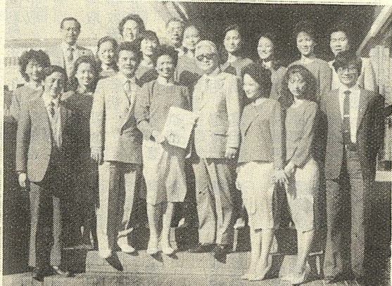
△在非京我國駐南非大使館官邸前與楊西崑大使合影

(本報特稿)中國文化大學友好訪問團在非洲做了二十五天的表演訪問後，在團長鄭向恒教授率領下，帶著滿意的欣悅、豐碩的成果，於本月二十二日返回本校。 本校友好訪問團，是應留尼旺飛豹體育協會及南非約翰尼斯堡中華文化中心之邀，於七月廿七日前往留尼旺、模里西斯、南非等地訪問表演。據團長鄭向恒教授表示，此次訪問活動，其最大目的是藉著華岡人的才藝及一股愛國的熱情，以宣慰海外僑胞，促進中非友誼，並宏揚中華文化。 訪問期間，該團做了十四場的歌舞