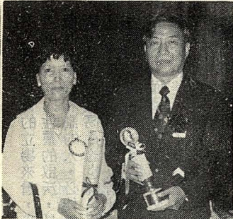
山影中合贈人領夫獲與授後曾獎雪為術（圖學）

在治學的旅途中，曾教授不沽名弋利，僅過著澹泊的生活；一秉其志，終日與書為伍；塵世的繁華榮華都不曾在他的生活中盪起微漪。但是一提到他所潛心的臺灣史，他就神采奕奕，就在那奕奕的神采中，流露出那份有如「啞巴吃蜜糖、有甜說不出」的為學之樂！（記者：吳淑卿）