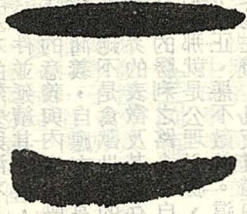
△圖一：甲骨文運筆法