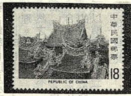
圖六：三峽清水祖師廟