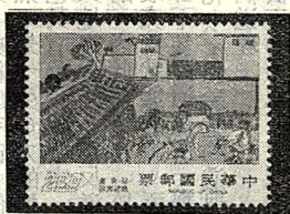
圖六：三峽清水祖師廟