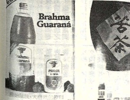
△圖為各品牌汽水的廣告(直的高雜誌廣告,橫的高報紙廣告)