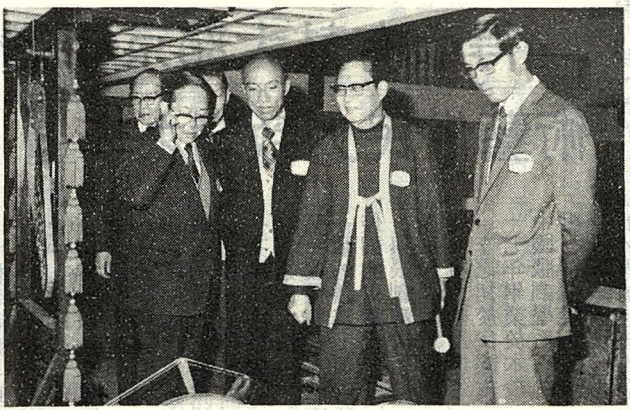
圖一：參觀國樂樂器陳列室，由莊副校長（右二）主持簡報。