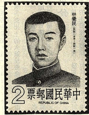
林覺民 中華民國郵票 2

本項郵票發售期間定為六個月，逾期各局窗口一律停售，惟持有此項郵票之公衆仍可繼續使用，並不受上述發售期間之限制。