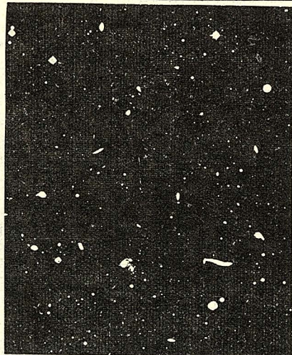
圖一：後髮星座 (Coma Berenices) 附近的星系，中間碟形的光體，都是與銀河系類似的星系，每一類星系約有二十億和太陽類似的星。

我們在夜空中能以肉眼看見的星星，除了太陽的行星外，都是叫做銀河系的恒星大集團的一部份。銀河系的形狀，從離銀河系極遠的位置看，是一種薄圓盤型。所以，銀河系從橫側面方向望過去，乃是一條帶狀的密集星群。我們所謂的天河，就是指的銀河系。我們已知，這圓盤的直徑約為十萬光年，厚約為三千至五千光年左右。圓盤的中心部份，星星密集，越到邊緣，星星越稀疏。圓盤狀的銀河系，從它的正下方望上去，星星是從中心向周圍，以漩渦狀分佈著的。我們的太陽，就剛好位在這漩渦臂的邊緣上。為什麼銀河系會形成一種漩渦狀呢？因為，以銀河系全體而言，越靠中心部份，旋轉運動越快。因此，周圍的漩渦臂是被快速旋轉的中心部份拖曳著旋轉，形成了整個銀河系的漩渦狀的。整個銀河系旋轉一周所需的時間大約是兩億年。這種銀河系的構造，從前始終無法以望遠鏡觀察清楚。直至最近，由於電波望遠鏡的發明，其詳細的情形才逐漸大白於世的。