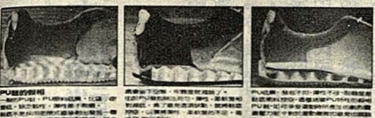
鞋底鞋面一體成形