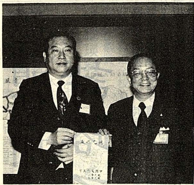
唐主任與徐系師長在桃園縣政府合影。右為徐系師長，左為唐主任。

此次桃園考察團，就是在唐主任此種精神號召下，學社全體幹部的努力下，進行桃園地區的參觀訪問。此次行程為中正國際機場作業參觀；拜會桃園縣政府，聽取簡報；慈湖謁陵；大溪古鎮巡禮；三峽祖師廟頂禮。此次行程可說緊湊