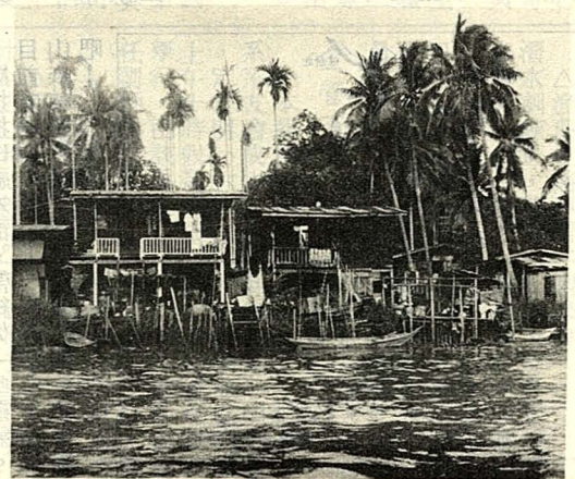
△泰國水上市場旁椰林掩映下之高脚屋

椰漿、椰糖、豆果子混合的果汁，喝到嘴裏滿口椰香，十分新奇，而用椰汁與紅糖混合製成的粗糖棒，更是饋贈親友的好禮品，另外他們紅燒咖哩雞一定要放椰粉以增風味，沙爹用椰葉桿將肉塊串起燒烤，都是取其椰香，而形成特殊風味。