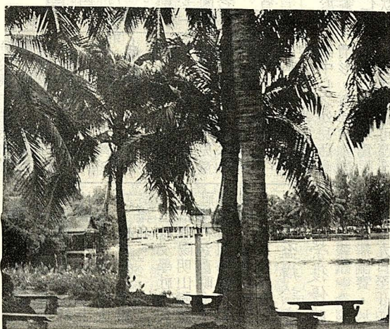
△椰林掩映下的泰國玫瑰花園