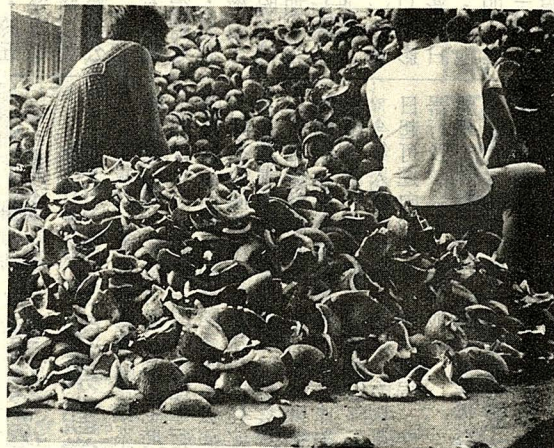
△菲律賓賓榔油加工廠內去了殼的椰肉

前面提到對人類較有經濟價值的椰子，如棗椰果實可以生食及加工，油椰子果實及核仁可用於榨油，糖椰子花序汁液可製糖及釀酒，檳榔子可生食也可作藥材，西殼椰子的莖可取出澱粉作布丁及漿糊原料。下面以可可椰子為例來談談椰子的經濟用途。 可可椰子在作物分類中屬油類作物，除了作食用油、人造奶油、甘油外；它的用途十分廣泛，如椰汁清甜退火可作飲料；椰肉可生食或打汁；椰粕可作飼料及肥料；椰殼可製成茶壺、煙具、杯碗或雕刻成裝飾品及工藝品；果皮纖維可作掃帚、繩子；樹幹可充作建築與橋樑之材料，椰葉可蓋屋頂及編織成地席、籠筐、和作燃料；椰葉骨幹可製掃