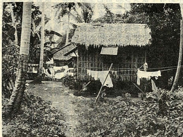
△菲律賓椰林之高脚屋

椰漿、椰糖、豆果子混合的果汁，喝到嘴裏滿口椰香，十分新奇，而用椰汁與紅糖混合製成的粗糖棒，更是饋贈親友的好禮品，另外他們紅燒咖哩雞一定要放椰粉以增風味，沙爹用椰葉桿將肉塊串起燒烤，都是取其椰香，而形成特殊風味。