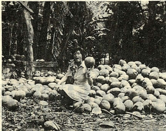
△菲律賓椰林底下剛採收的椰子

子置於店前任顧客挑選，喝完通常連椰肉帶殼一起去棄，十分可惜，但因價廉，大家都 不覺心痛。在通往風景勝地百勝灘的途中，椰林密佈，一路上兩旁草棚，堆滿了椰子山，吸引著遊客下車品嚐。我最佩服非人剝椰子的技術，堅硬之外殼，他們有本事把椰殼整個破開，將裏面圓圓的含內殼的種實取出，開個洞，吸盡椰汁後，再把種實外面那層薄薄棕色的外殼去掉，雪白的椰仁便可生食或加工，製成椰乾外銷，非國椰肉加工廠均十分簡陋，也不衛生。種實置於室外，任憑風吹雨打，剝好的椰仁置於室內地上，沒有容器盛著及包裝。到那兒考察時我曾參觀過幾間椰子加工廠，到那兒喝椰子水是免費的，只要把椰肉還給工廠便可，有的椰肉內有椰母像塊白色的鮮奶油，芳香而柔軟，十分可口，非人稱這種椰子為椰子王，據說要老椰樹才結的出來。 在泰國椰子的切法與非不同，他們把椰子烤來吃，在國際觀光勝地芭泰雅海灘就有這種叫賣攤販，椰子也是大涼的水果，烤了以後吃比較溫和，椰汁也比較甜。在曼谷街道常可看到婦女挑著米製而混有一種椰子的點心在沿街叫賣，在北檳榔魚湖還有一種椰子糕十分清甜可口，深具地方色彩。馬來西亞出產的香椰糖、用椰油炒的咖啡豆，均香濃可口，而在檳城有一種小吃叫煎洛（Jelok）是以