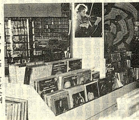
圖二：唱片的製作，首重企劃