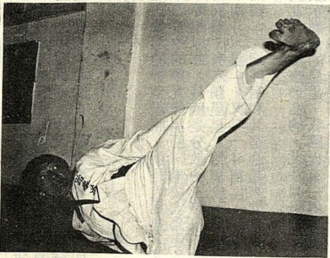
跆拳道最難研習之技擊——鉤踢（掛腿）

閱近，幸教正之。 一、各社團教學資料皆影印一份送贈他社團。此教學資料包括精編上課教材，初學者容易疏誤之處，各階段社員練習心得及對教學方法之反應。而於本家武技之精華，更應詳述其練習方法，在對練、搏擊中的應用時機與訣竅。 二、允許他社團有相當基礎之學員到社上練習的機會。譬如：護身倒法，乃各門武術應習之課程，困於場地，均付闕如。倘能到柔道社練習，則臺灣因腦震盪死亡的比率當可降低。至於時間與人數可能造成的衝突或擁擠，應可事先協議解決。 三、各社社長應每月至少一次邀請他社團之學生教練到社上教授該社之重要武技，但學員限於對社上武技有相當基礎者。 四、各社團應彼此交換高階社員至他社專研該社絕技，於相當期限內，回社指導。 五、各社團學生教練應定期集會研討武學，求武術之層次精進與科學化。並於不疑處有疑，方能突破圓周的界限，品