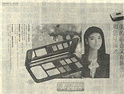
佳麗寶推出「美的組合」