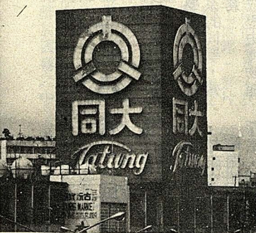
△中華商場上的十座霓虹燈塔之一——大同公司