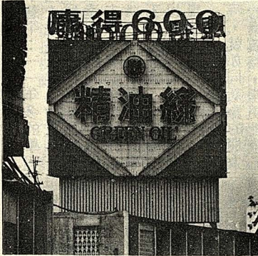
△中華商場上的十座霓虹燈塔之一——綠油精