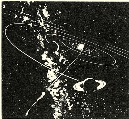
△上圖（圖一）為太陽系之全貌，圖中一顆彗星正運行向太陽，背景就是大家熟知的銀河。

假如各位對於上面提起的大小比例已有概念，那麼且讓我們作次短暫的超時空跳躍飛行吧！（請拿出各位的想像力）簡報：各位宇宙航艦的隊員們，我們此行的任務是了解宇宙的大小。打開指揮室的螢光幕，我們看到的是四周的人群，請各位注意螢光幕顯現的影像。檢查報告！一切正常，發動引擎，轟！我們起飛了！螢光幕上的人影愈來愈小，一會兒已見到整個地球了。各位大都是第一次從事太空旅行，別緊張，好好地欣賞我們美麗可愛的地球吧！找找看，我們親友在那兒？找不著！人現在比螢光幕上的一個黑點還小囉。繼續我們的旅程吧！紅紅的火星，上面好像有河流，會不會有火星星人？喔！巨大的木星、大紅斑……，土星的光環……，天王星、海王星、冥王星。真快，一下子就飛離太陽系了（圖一）。地球好遠又好小喲！不知道臺灣：上我的家在：什麼地方？從這看人那豈不是像一細菌？領航官報告：目標，M31大星雲。預計兩小時後脫離本銀河系引力圈。螢光幕上出現一團像漩渦的……（圖二），啊！是本銀河系，我們生存的銀河系！你們看！那一點就是——太陽系所在的位置嗎？哇！我們周圍都是大大小小的銀河系，不知有多少？可是距離我們太遙遠了，只能見到一個光點而已。浩瀚的宇宙，無邊無際，深奧得令人神往。輪機官報告：主引擎故障，已開動輔助引擎維持動力，但須緊急降落，方能修護。於是調頭、迫降在陽明山華岡。