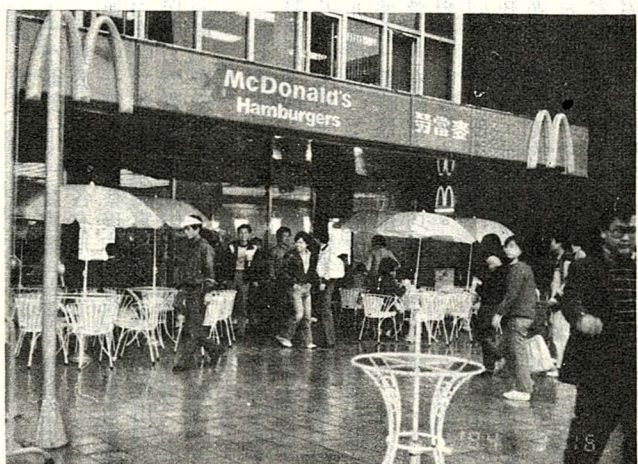
● 整齊、美觀的新式餐飲店

是事先將材料調配好，並烹調至某一程度，然後經高溫殺菌或急速冷凍，再加以密封真空包裝，食用時僅需簡單加溫即可，在各大大食品業大力開發下，深信調理食品將會成爲最有潛力的食品之一。