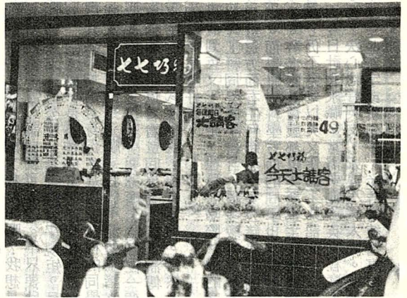
●中式餐廳的新趨勢——速簡餐廳

中國菜給人的印象是色、香、味俱全，而中國餐館給人的印象則是髒亂、不衛生，如何使美味的中國菜與餐館配合，而臻於國際標準，讓工商社會忙碌的人們亦能在衛生而快速的情形下享用中國美食，正是國內餐飲業者急待突破的瓶頸，「中式速簡餐廳」就在這種情形下應運而生。