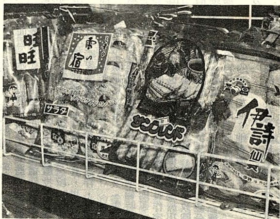
●品牌很多，難以取捨