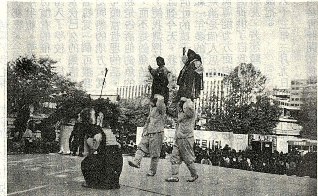
△書展露天舞台上的民俗表演

、美食可嘗，是個老少咸宜的好去處。難怪吸引了成羣結隊的人們，有父母攜帶子女來的；有老師率領學生來的；也有祖孫三代同堂的；是那樣的融洽和樂，他們在一片書香中渡過美好的一天假期。 因為我不懂韓文，走馬看花的瀏覽一下，就和李氏夫婦協議好，他們繼續參觀書展，而我去欣賞節目，兩小時後在服務台前集合。 不久，一陣鼓樂聲響起，舞台上舞出了兩頭獅子，主持人宣佈節目開始，部份遊客立即擁向舞台四周，我也遠遠佇立一角，欣賞一個接一個的精彩節目。原來他們和我們一樣，以舞獅作為開場。中、韓兩國文化的為主，由此可知。節目以傳統和民俗的為主，獅子過後，接著是「宮廷」舞，但見身材一致的美妙女子，著了傳統的韓服、頭戴鳳冠、五彩繽紛、雍容華貴地配合節奏，翩翩起舞；接著是「太平」舞，內容是慶祝「秋收豐年」的。但見一位男士高舉「農為天下之大本」的旗幟，領著舞者出場，之後是「羽扇」舞，「結婚迎親