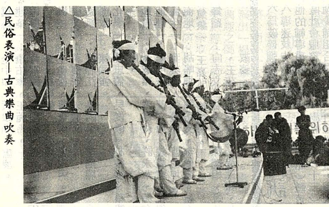
△民俗表演——古典樂曲吹奏

、美食可嘗，是個老少咸宜的好去處。難怪吸引了成羣結隊的人們，有父母攜帶子女來的；有老師率領學生來的；也有祖孫三代同堂的；是那樣的融洽和樂，他們在一片書香中渡過美好的一天假期。 因為我不懂韓文，走馬看花的瀏覽一下，就和李氏夫婦協議好，他們繼續參觀書展，而我去欣賞節目，兩小時後在服務台前集合。 不久，一陣鼓樂聲響起，舞台上舞出了兩頭獅子，主持人宣佈節目開始，部份遊客立即擁向舞台四周，我也遠遠佇立一角，欣賞一個接一個的精彩節目。原來他們和我們一樣，以舞獅作為開場。中、韓兩國文化的為主，由此可知。節目以傳統和民俗的為主，獅子過後，接著是「宮廷」舞，但見身材一致的美妙女子，著了傳統的韓服、頭戴鳳冠、五彩繽紛、雍容華貴地配合節奏，翩翩起舞；接著是「太平」舞，內容是慶祝「秋收豐年」的。但見一位男士高舉「農為天下之大本」的旗幟，領著舞者出場，之後是「羽扇」舞，「結婚迎親