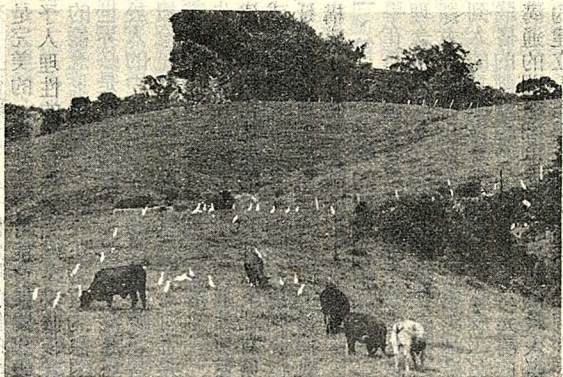
△寬廣遼闊的墾丁牧場

華岡羅浮群為使全校同學對墾丁恆春半島，有更深一層的認識，特別舉辦此次大露營，墾丁國家公園帶給我我們在空曠中面對海洋、星月、樹林、花草、彩霞、野生動物的一種遺世獨立的感覺，實現我們夢中的奇遇。