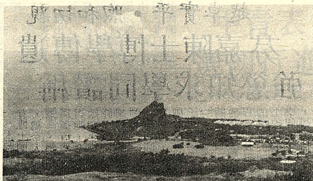
△從墾丁觀海樓下眺大尖山之一景

墾丁公園風景面位處恆春鎮的東南側，以墾丁森林遊樂區為中心，並包括鄰近的墾丁牧場區及墾丁海濱區。墾丁森林遊樂區面積達四百三十五公頃，為本省唯一的熱帶植物園，也是世界八大試驗林場之一。整個公園可區分為三個部份，第一遊樂區座落在最前頭，是以植物景觀與人工建設融合的遊賞區域；第二遊樂區則是以地形景觀和植物景觀，相互搭配而成的區域；最後頭是第三遊樂區，短期內尚不開放，為一純原始的珊瑚礁雨林帶，擁有熱帶樹種一千多種，包括有三年以上的茄冬巨木，岩壁上垂有千條巨榕氣根的垂榕谷，側根突出地面一二公尺的銀葉板根等，除了植物景觀外，森林遊樂區還留存有因岩石從上到下裂為兩半，獨留一線空隙可望天的「一線天」及「第一峽」；佈滿鐘乳石和石筍的石筍竇穴；台灣最大、最長的珊瑚礁岩洞內，佈滿了奇形怪狀的鐘乳石；仙洞、銀龍洞等均為特殊地形景觀。區內並建有海亭樓、觀海樓、雨傘亭等，可眺望望鵝鑾鼻、太平洋海峽、巴士海峽、台灣海峽、中央山脈及公園全景。三個區域各有特色，為墾丁公園帶來無以計數的遊客在這裏，旅遊觀光沒有大、小月之分，公園內一年到頭瀟灑著看樹、看地形、看風景的人潮。