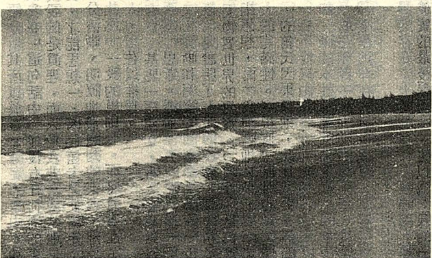
△墾丁海水浴場之一景