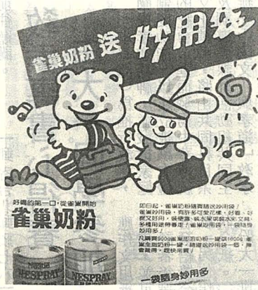
圖四：隨物贈品以達成銷售目的

其他忠於競爭品牌之消費者，則非促銷活動所能掌握。 爭奇鬥絕·怪招百出 促銷廣告如前述，乃在爭取顧客的指名購買，且短時間內便需獲得成效，所以威脅利誘、行欺詐騙無有不奇。茲舉出下列數案，與同學們共欣賞： 1. 一山二虎 現今廣告界兩巨頭當推美國、日本，也代表著東西不同之民族性。西方者流總是開誠佈公，採單刀直入之介紹方法，東方者流較含蓄，採拐彎抹角之暗示原則。（圖一） 2. 賠本生意 殺頭生意雖不可爲，賠本生意也做不得。爲何偏有人願作犧牲