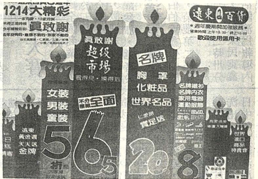
圖六：折扣折扣就是為了促銷

5. 大贈獎 豪華的大獎極易引人入彀。一券在手希望無窮，即使未中獎，也不覺痛癢。而企業除增加銷售外，又能根據信函作初步之市場調查，不失爲一良好促銷方式。（圖五） 6. 折扣折扣 現金折扣促銷乃各行各業中十分有力的武器。消極面可減少換季存貨，以免資金積壓；積極面又可大量增加銷售，於短時間內創造高業績。但過度使用此法，將影響非折扣時期之正常營運。（圖六）