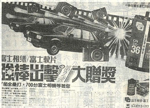
圖五：豪華大獎極易引人入彀

者？新產品之提供消費者試用，非但刺激消費者使用該商品，且能在廣告上造成一股力量。（圖二） 3. 天時難逢 把握機會而非追蹤機會。去年底當經濟部能源委員會發表「迅速打出省油冠軍的口號，取得十分有利的時機。」（圖三） 4. 醉翁之意 隨物贈品常利用一般人貪小便宜，達成其銷售目的。而兒童小玩物更具吸引力，孩子們甚至只爲小玩品而已。隨商品附贈精巧設計之精緻小飾品，即使市面上亦難購得。（圖四）