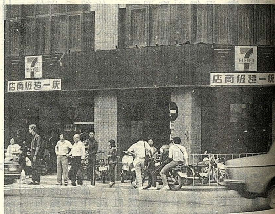
連鎖經營的超級商店

我國零售業之未來發展方向，將朝向無店舖銷售方式及大型綜合購物中心（SHOPPING MALL）兩線發展。