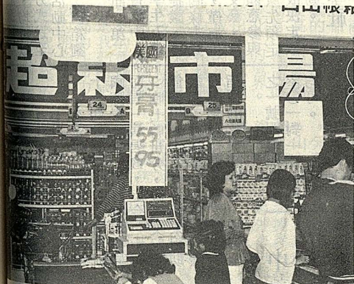
百貨公司的超級市場。