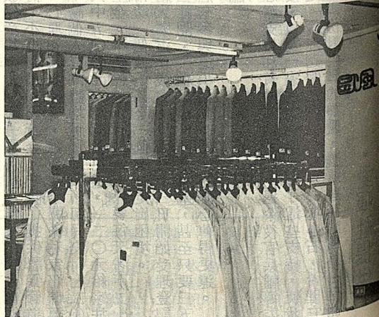
新購物環境講求明亮寬敞

據聞，國內第一座現代化的大型購物中心，可望在信義計劃區內出現，成為我國推動零售業現代化的示範指標。此大型購物中心之優勢在於其能實施有關