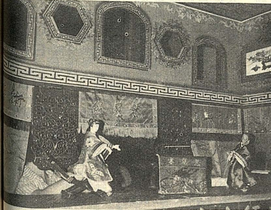
上圖為仗頭傀儡戲「過橋」中之一景。下圖為古典布袋戲「岳母刺字」岳